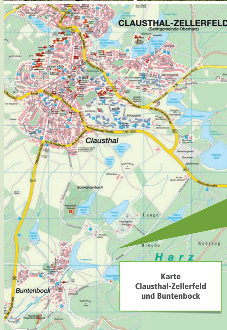
Karte Clausthal-Zellerfeld und Buntenbock