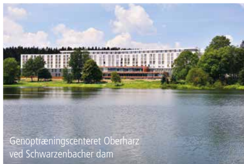
Genoptræningscenteret Oberharz ved Schwarzenbacher dam

Oplev og nyd „Buntenbocker Bergwiesenweg“ de mange farverige blomstrende arter på bjergengene.